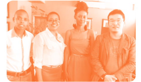
南部アフリカの山岳王国レントでLGBTのグループと

大切なことは2つ。2030年までに貧困のない世界をつくること。そしてつづき世界をつくること。世界は放っておけば貧困が深まり、格差が広がるような仕組みになっていて、先進国の私たちは再生産できる資源の1.5倍を使いつづけています。SDGsは途上国だけでなく先進国の目標でもあります。