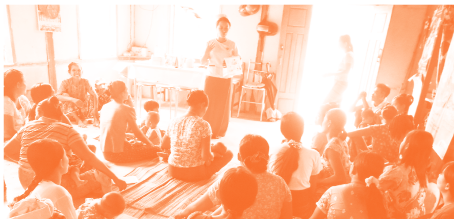
村で母子保健教育を受けるお母さんたち

らは以前知らなかったことを知る機会になった、妊娠中の生活の過ごし方や産後の家族計画の重要性がわかったなど前向きな言葉が聞かれています。今後もタツコン郡保健局や村人と協力し、全てのお母さんと赤ちゃんが健康に過ごせる地域を目指していきます。