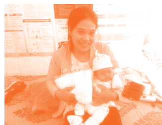
産後検診に来た母子にギフトを贈呈