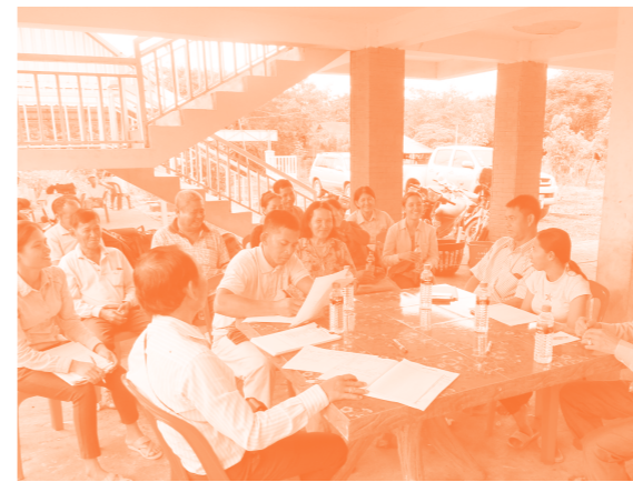
保健センター運営委員および保健ボランティア会議の様子

事業開始当初、私たちが支援している保健センターは様々な理由から、施設が地域にあるものの地域住民にあまり利用されていない状態でした。保健センターは24時間体制で運営すると保健省は定めています。実際にはスタッフの出勤がまばら、週末はスタッフ不在で連絡