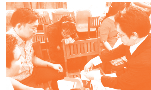
ミャンマーでの高度医療トレーニング

医療というのは万国共通のもので、国境はないと考えています。これからも発展途上国を中心に、医療の環境、技術が未だ十分ではない人たちに対して支援をしてきます。また、(株)八神製作所は、これまでモンゴル及びPHJの活動地でもあるミャンマーにおいても日本の医療支援チームに参画し、高度な医療技術のトレーニングに立会い、医療機器のアドバイザーとしてサポートにあたり医療協力に関わっています。